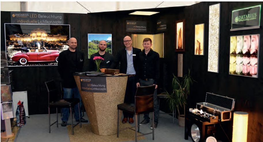
Bei der Wirtschaftsmeile 2014 sorgte unser Stand für reges Interesse bei den Besuchern.

Wir möchten unsere Produkte in einer gemütlichen Atmosphäre präsentieren und daher haben wir uns etwas ganz Besonderes ausgedacht: Momentan sind wir dabei unsere Räumlichkeiten umzubauen und eine LED-Lounge einzurichten. Nach Fertigstellung der Umbauarbeiten findet eine Eröffnungsfeier statt, bei der wir Sie gerne dabei haben möchten. Eine Einladung erhalten Sie rechtzeitig per E-Mail.