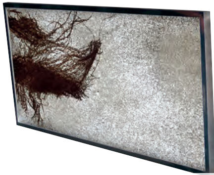
Klassisch und modern im Alurahmen mit Baumrinde und Lechsand ...

Am 11. April 2014 lud die Standortagentur Tirol die Mitglieder des Cluster Energie zum „Branchentag Energie“ ein. Im Mittelpunkt stand dabei die Energieversorgung der Zukunft. Die Anwesenden erhielten umfangreiche Informationen über effiziente, klimafreundliche und intelligente Möglichkeiten Energie einzusparen. Im Rahmen einer Leistungsschau präsentierten 30 Unternehmen Energielösungen für die Zukunft.