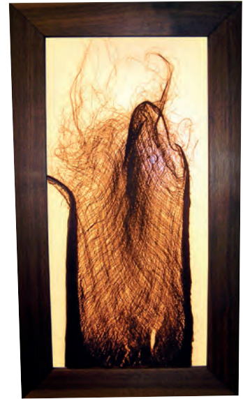
.. oder elegant und edel – mit Kokosfurnier und Nuss-holzrahmen.

Apropos Design: Als ganz spezielles Design-Zuckerl ist das neue Panel mit Beschichtungen der Tiroler Firma Organoid Technologies erhältlich. Organoid entwickelte eine neue Methode um Flächen aller Art mit Beschichtungen aus diversen Naturmaterialien zu versehen bzw. sogar alle möglichen