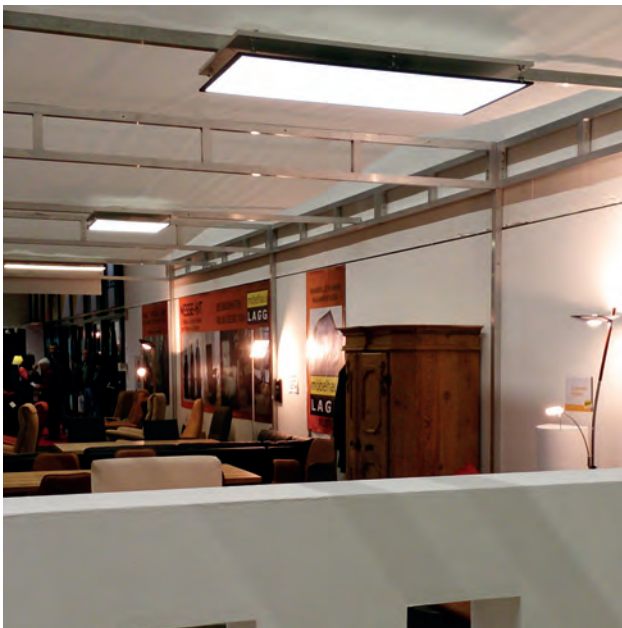
Durch die gleichmäßige Lichtverteilung und das weiche, absolut blendfreie Licht überzeugten die Panels auf der Innsbrucker Herbstmesse.

Bei der Innsbrucker Herbstmesse 2013 sorgten unsere Panels für die perfekte Beleuchtung der Ausstellungsflächen des Möbelhaus Lagg. Auch in den Einrichtungsplanungen des Möbelhauses finden die LED's von DaTARIUS immer öfter Verwendung.